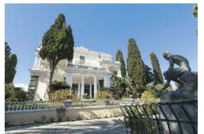
Achilleion, het paleis van keizerin Sissi.

«Dit is mijn asiël, hier trek ik mij terug uit de wereld.» In 1861 bezoekt Elisabeth van Oostenrijk Korfoe voor haar gezondheid. Ver van de strakke hofetiquette en haar ongelukkig huwelijk komt ze tot rust en voelt ze zich vrij. Ze keert terug in 1871, bezoekt meer Griekse bestemmingen en besluit in 1890 tot de bouw van een eigen paleis op Korfoe: Achilleion. Hier wil ze blijven. In 1898 wordt de keizerin in Genève vermoord door een anarchist. Niet lang daarna verkoopt haar dochter Gisela het paleis aan de Duitse keizer Wilhelm II.