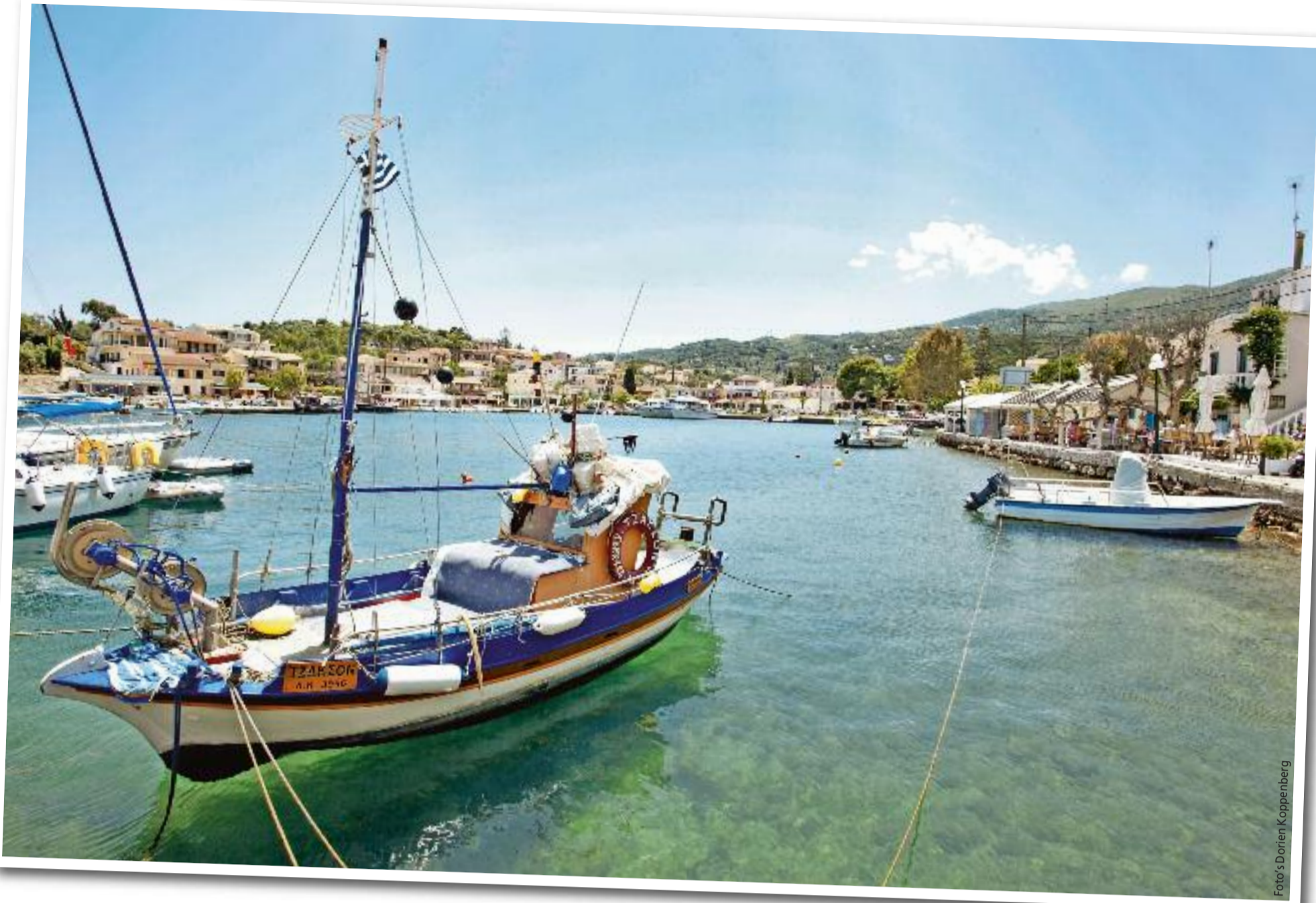
Het idyllische haventje van Kassíopi, perfect om even tot rust te komen.